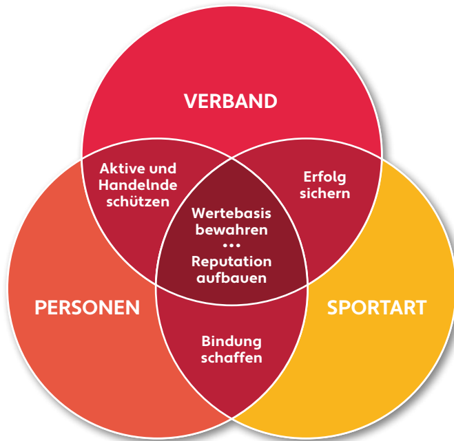
Abb. 2: Nutzen von Good Governance

Nachfolgende Abbildung soll die Zusammenhänge verdeutlichen: